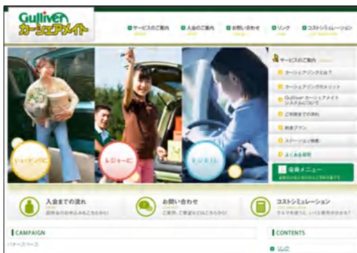
Gulliverカーシェアリングホームページ