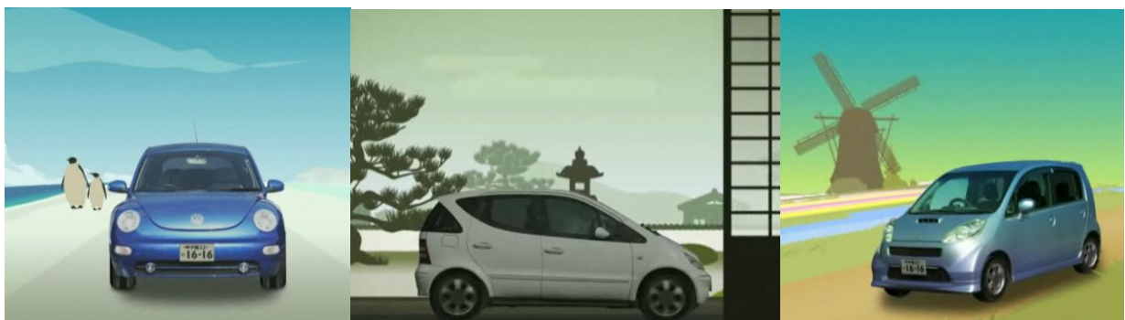
ブービーイロイロ

※ガリバーの買取保証型ローン「楽のリプラン」とは・・・3年後の価値を算出し、その分を差し引いた金額が月々の支払い額になります。ガリバーは2月末まで、月々の支払い最低額を従来の5,800円から1,900円に引き下げると同時に、金利も7.8%から5.8%に引き下げます。